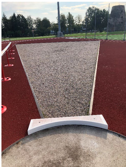
Lodes grūšanas sektors – ACO Sport 7100.