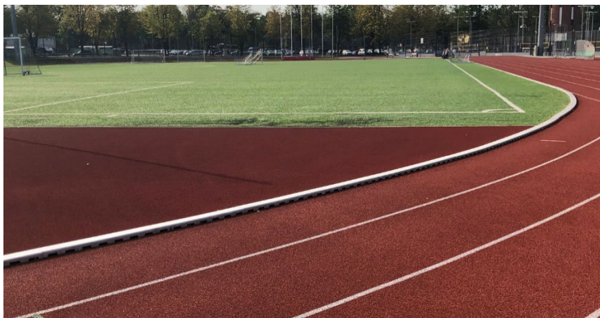
Skriešanas celiņu malu kanālu sistēma.– ACO Sport 1000