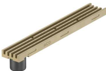
Kanāls 1m ar izvadu dabisks