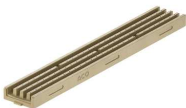
Kanāls 1m dabisks