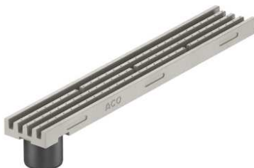
Kanāls 1m ar izvadu pelēks