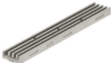
Kanāls 1m pelēks