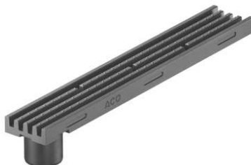
Kanāls 1m ar izvadu antracīts