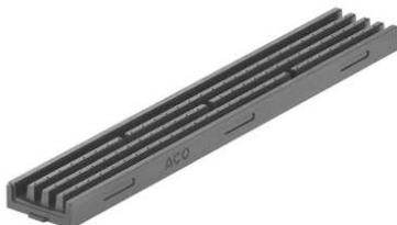
Kanāls 1m antracīts